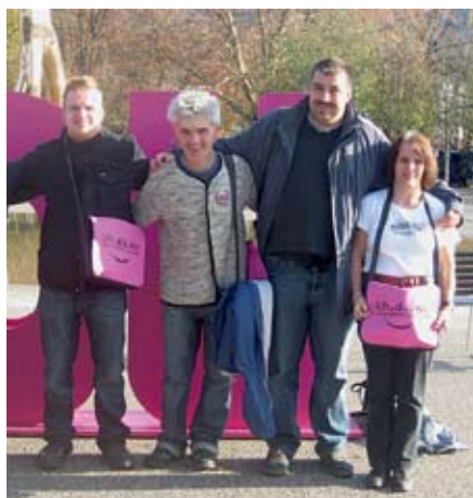
Bewohner aus Meckenbeuren beim internationalen Kongress in Bregenz.

BREGENZ – Unter dem Motto „ich. du.wir – Verschiedenheit als Chance“ trafen sich mehr als 250 Menschen mit und ohne Behinderung aus sechs Ländern im Festspielhaus in Bregenz.