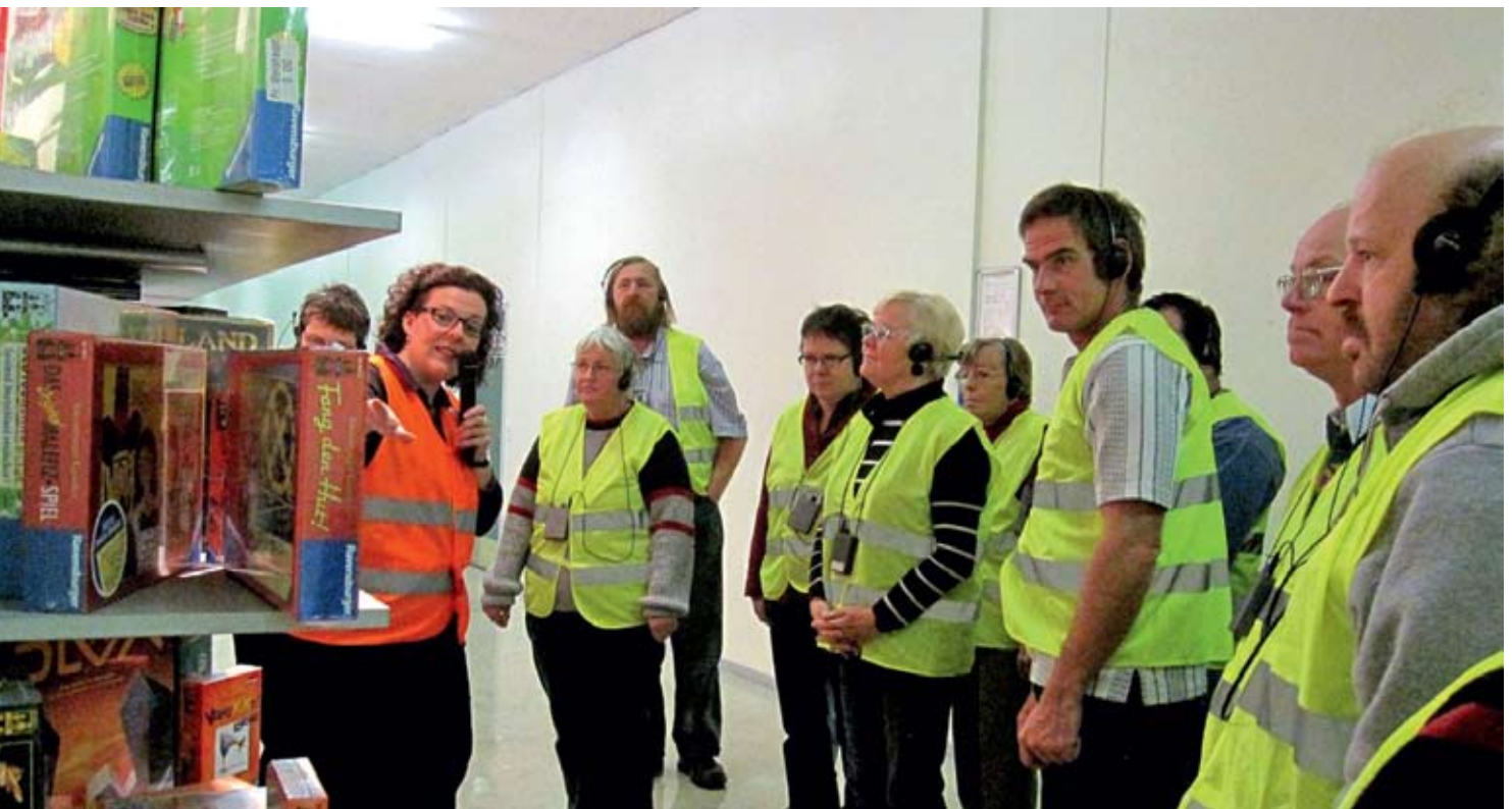
Während der Betriebsführung bei der Firma Ravensburger erfuhren Menschen mit Behinderung viel über die Herstellung von Spielen.