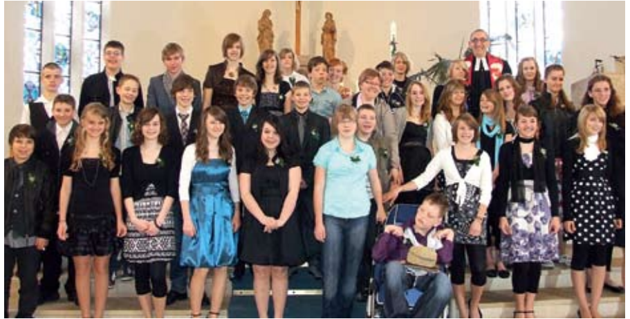
Bei der kooperativen Konfirmation in der Kirche St. Maria in Liebenau feierten Jugendliche aus Meckenbeuren und Hegenberg gemeinsam die Bestätigung ihrer Taufe.

In der Kirche St. Maria in Liebenau zelebrierten die Jugendlichen die persönliche Bestätigung ihrer Taufe und den damit verbundenen Eintritt in das kirchliche Erwachsenenleben. Das Besondere dabei: Es handelte sich um eine kooperative Konfirmation von nicht behinderten Jugendlichen aus Meckenbeuren und Mädchen und Jungen mit geistiger Behinderung aus Hegenberg. Schon während der knapp einjährigen Vorbereitungszeit hatten sich die Konfirmanden mehrmals zu gemeinsamen