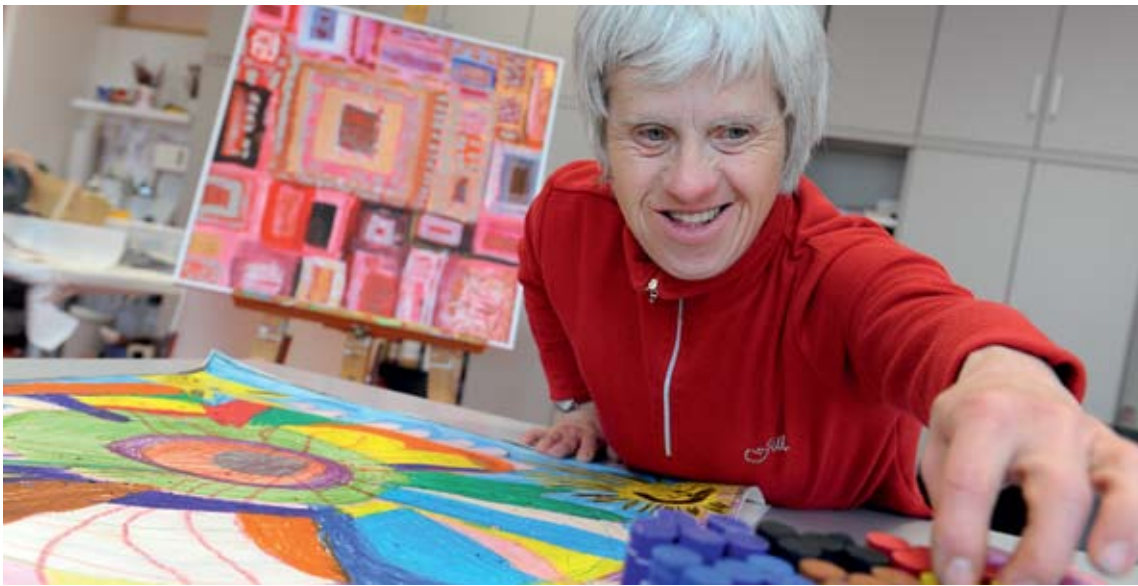
Bunt und voller Lebensfreude: In der Kreativwerkstatt in Rosenharz entstehen ganz besondere Kunstwerke.