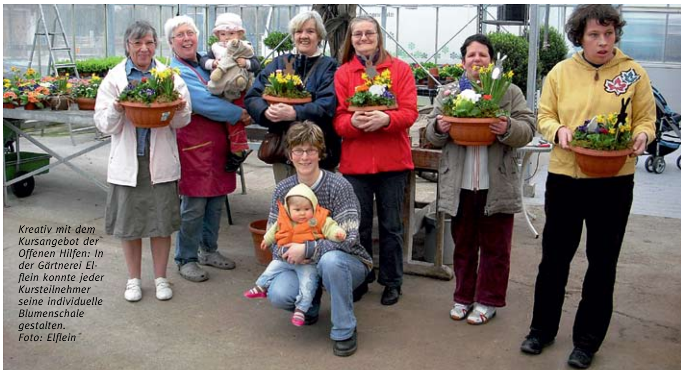
Kreativ mit dem Kursangebot der Offenen Hilfen: In der Gärtnerei Elflein konnte jeder Kursteilnehmer seine individuelle Blumenschale gestalten.

Für mich ist es immer wieder von Neuem spannend zu erleben, wie die Teilnehmer und Teilnehmerinnen miteinander umgehen und sich so akzeptieren wie sie sind, mit viel Sinn für Feinheiten und Details. Auch ich werde mit hineingenommen in diese spontane Gruppe, werde angesprochen, gescholten, aber auch anerkannt als Leiterin. Und da ich nun schon etwas länger dabei bin, werde ich auch oftmals freudig begrüßt, wenn wir uns wieder mal zu einem gemeinsamen Ausflug treffen.