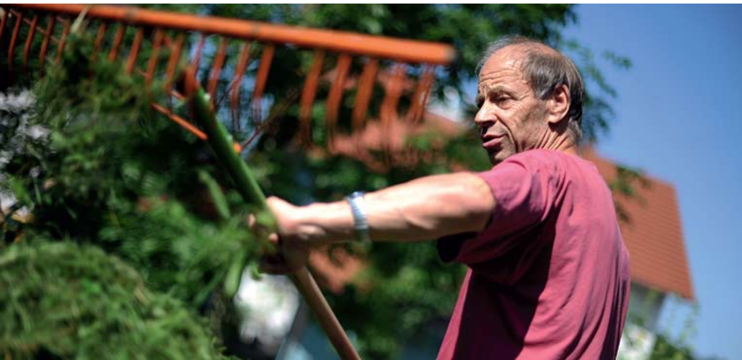
Arbeit im Grünen in der Gartenpflege und -gestaltung ist eines von vielen Berufsfeldern der Gallus-Werkstatt.