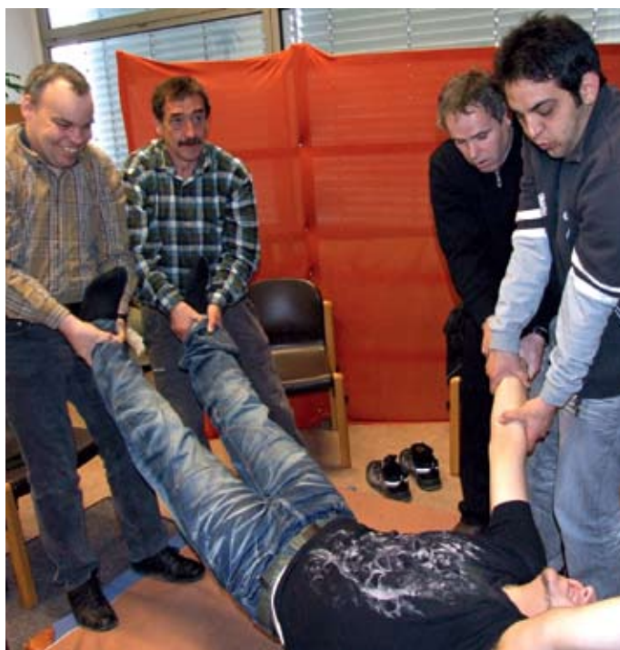
Männergruppe von Roland Steinbeck in Rosenharz: Jedem tut es gut, einfach einmal getragen zu werden.

Zusätzlich zur Suche nach dem Mannsein und den fehlenden Vorbildern komme bei den Männern mit Behinderung hinzu, dass sie mit Abhängigkeiten konfrontiert sind. „Auf der Wohngruppe gelten Regeln und Strukturen, die ein unabhängiger Erwachsener so nicht erlebt.“ Wichtig ist Steinbeck deshalb auch die Einbindung der männlichen Bezugspersonen in den Wohngruppen, die eine gewisse Vorbildfunktion haben. „Auch ihnen tut es gut, ihr eigenes Männerbild und ihren Umgang mit versteckten Gefühlen anzuschauen, was für mich selbst übrigens genauso gilt.“