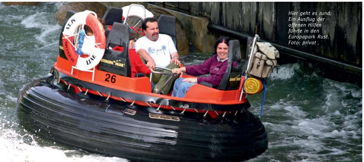
Hier geht es rund: Ein Ausflug der offenen Hilfen führte in den Europapark Rust.