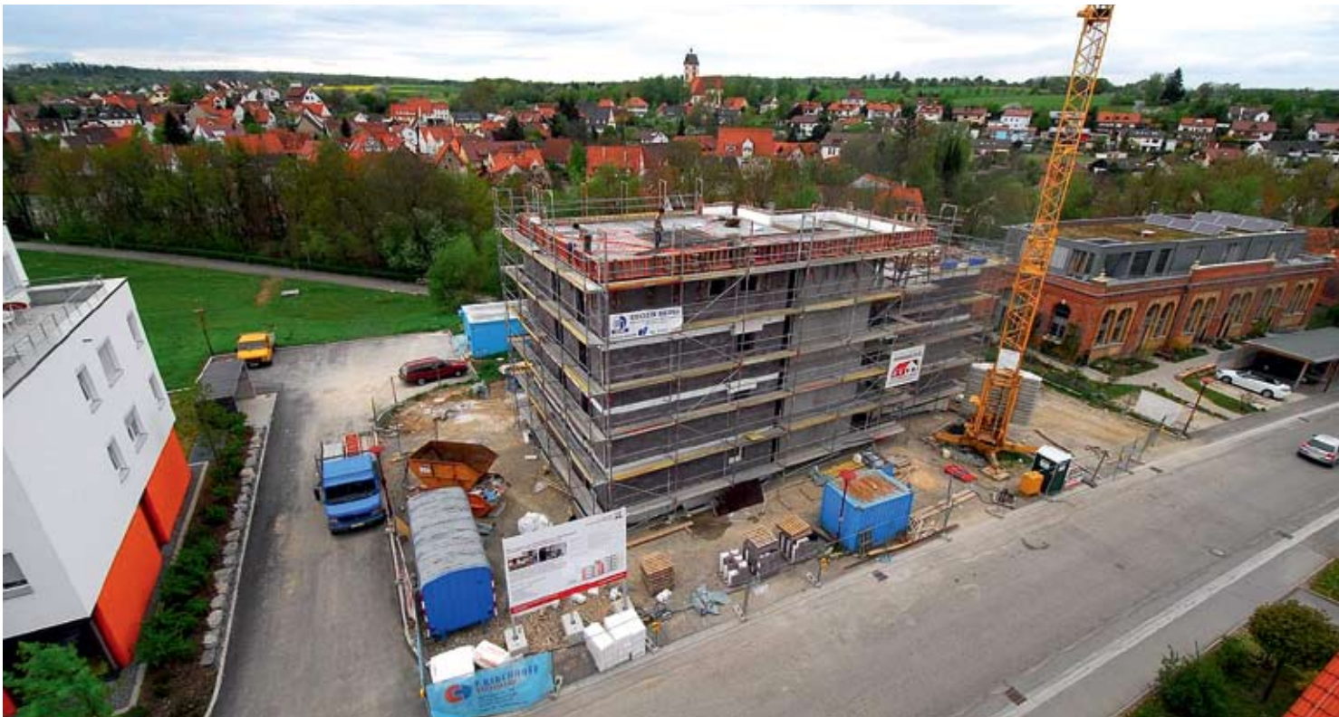
Die Wohnanlage, die künftig von der St. Gallus-Hilfe für behinderte Menschen betrieben wird, fügt sich in die neue Ortsmitte von Dußlingen, in unmittelbarer Nachbarschaft des Bahnhofs (rechts) und des Gemeindepflegehauses.