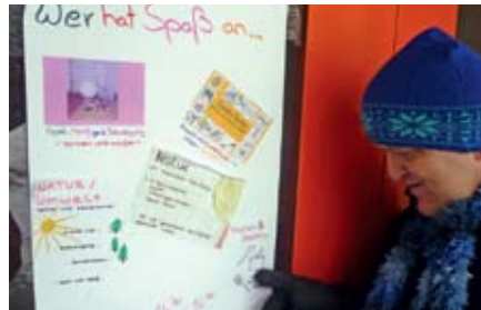
Ausbildung mit Praxisbezug: Das Angebot zum Thema „Basale Bildung“ für Menschen mit hohem Hilfe- und Assistenzbedarf.

Die vielfältigen Angebote sollen den Menschen Entwicklungs- und Erfahrungsmöglichkeiten geben. Sie haben den Anspruch, wenn auch in kleinen