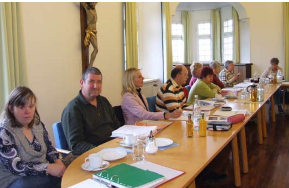
Gemeinsame Veranstaltungen von Angehörigen- und Heimbeirat: Zweimal im Jahr treffen sich die beiden Gremien zum konstruktiven Gedankenaustausch zum Wohle der Bewohner der St. Gallus-Hilfe.