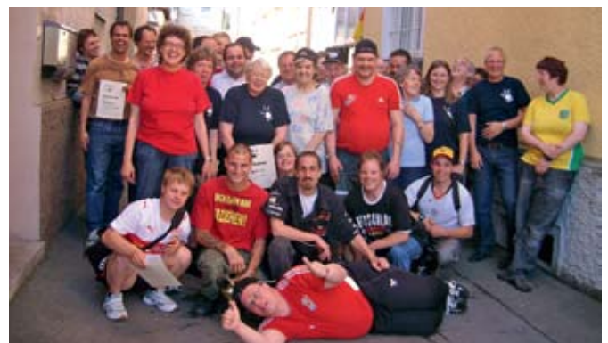
Beim Kegeln kommt auch die Geselligkeit nicht zu kurz.