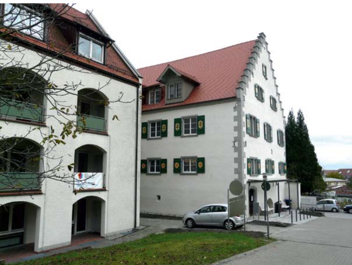
Das Gebäude aus dem 16. Jahrhundert (rechts) hat bereits viele soziale Einrichtungen beherbergt. Seit Anfang Oktober bietet die Frühförder- und Beratungsstelle der St. Gallus-Hilfe hier Familien mit einem Kind mit Entwicklungsverzögerung oder einer Behinderung ihre Unterstützung an.